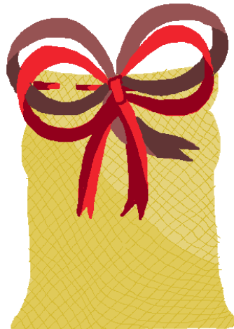
Café artesanal de Zoquiapan, Cuetzalan, Puebla